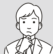
社員やパート、業務委託の方