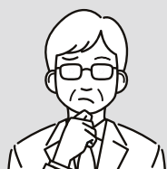
総務や人事経営者の方